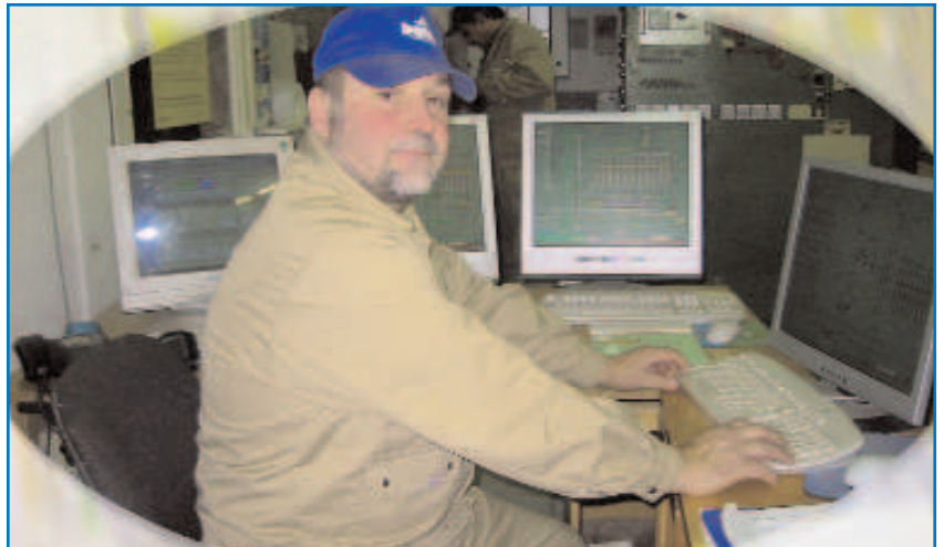
GIP automatisierte die Produktionsanlage von Bosch in Blaufelden-Wiesebach mit dem Leitsystem VarioBatch ®